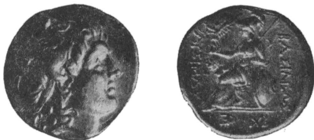
Fig. 1. Stater de aur purtind numele lui Lysimah, găsit la Sarmizegetusa Regia (mărime 2×1).

Av. Capul divinizat a lui Alexandru cel Mare spre dr., purtind diademă și coarneau lui Zeus Ammon. Deasupra creștetului un mic glob.