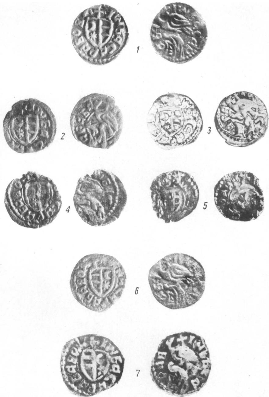
Pl. I. — Ducați bătuți de către Basarab Laiotă; nr. 1—5, emisiuni din anii 1473—1475; nr. 6—7, emisiuni din anii 1475—1477 (2 × 1).