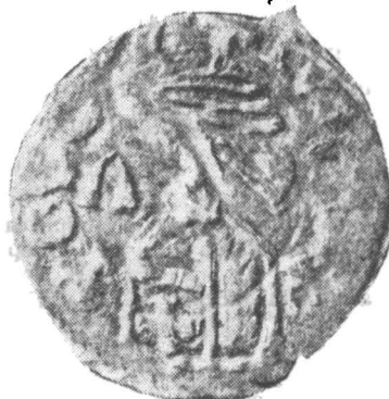
Fig. 1. Ducat emis de Mircea cel Bătrîn; diametru real: 14 mm.

Se observă că din cele trei exemplare publicate pînă astăzi, greutatea este cunoscută pentru cel descris în 1911 și anume, 0,29 g, în vreme ce ultimul exemplar cîntărește numai 0,24 g. Sub acest raport, constatăm că emisiunea de ducați cu siglele de care ne preocupăm se încadrează sub media normală a ducaților lui Mircea cel Bătrîn de tipul comun, medie ce se ridică la 0,34 g 10 .