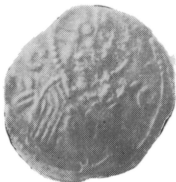
Fig. 1. — Ducat de argint de la Mircea cel Bătrîn (diametru real: 15 mm).