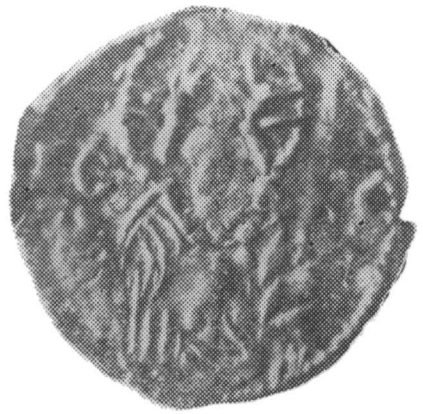
Fig. 3. — Alt ducat de argint de la Mircea cel Bătrîn (același diametru). Fig. 4. — Alt ducat de argint de la Mircea cel Bătrîn (același diametru). Fig. 3 — Autre ducat d'argent de Mircea l'Ancien (même diamètre). Fig. 4 — Autre ducat d'argent de Mircea l'Ancien (même diamètre).