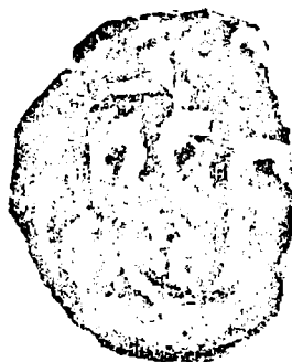
Alt sigiliu de plumb găsit la Suceava.

Ștefan cel Mare, epocă în care fărâmițarea feudală îmbracă în Moldova forme din cele mai caracteristice. E vremea în care dezvoltarea economiei feudale dă naștere fenomenului de transformare a rentei feudale: renta în muncă se convertește în renta în produse și apoi în renta în bani, formă ce predomină începând din a doua jumătate a secolului al XV-lea 3 . Circulația monetară începe să crească, astfel încât domni care stăpinesc scaunul Moldovei relativ puțin, ca Petru al II-lea, Roman al II-lea sau Alexăndrel, emit serii monetare proprii. Tezaurul descoperit lângă Leorda, martor al acestor transformări sociale, prezintă din acest punct de vedere o deosebită importanță. E deci regretabil că nu cunoaștem mai multe amănunte asupra componenței sale.