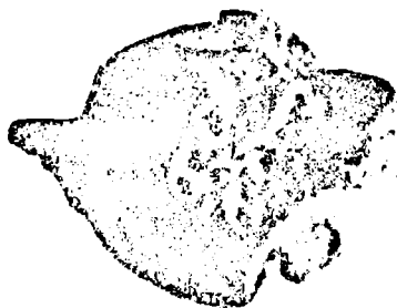
Sigiliu de plumb găsit la Suceava.