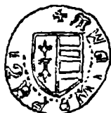
Gros de la Petru al II-lea (Biblioteca Academiei R.P.R., Cabinetul numismatic, nr. 16955)