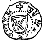
Gros de la Petru Aron (Biblioteca Academiei R.P.R., Cabinetul numismatic, nr. 16970)

celui de-al XVI-lea. Este știut că aceste monede nu s-au găsit pînă în prezent în tezaure monetare mixte, astfel încît atribuirea pieselor care poartă numele de Alexandru, Ștefan, Petru sau Bogdan se face cu oarecare greutate, dacă ne gîndim la faptul că în acest răs-timp, au fost atîția domni omonimi. Datorită acestei împrejurări, numismații sînt nevoiți să recurgă la criteriile mai puțin sigure, ca de pildă stilul monedelor, titlul metalului etc., pentru a stabili cărui domn pot fi atribuite anumite emisiuni monetare.