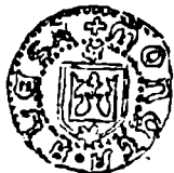
Gros de la Alexandru al II-lea.

(Biblioteca Academiei R.P.R., Cabinetul numismatic, nr. 16937)