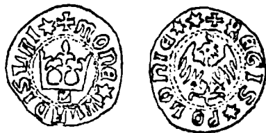
Monedă de la Vladislav Jagello.

Așa cum am arătat, notița din ziarul Epoca ne-a adus la cunoștință descoperirea unui interesant tezaur de monede moldovenești, ce datează din epoca anterioară înscăunării lui